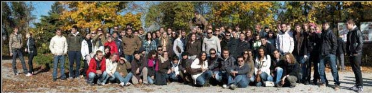
Moravian Karst, 18th Oct. 2008