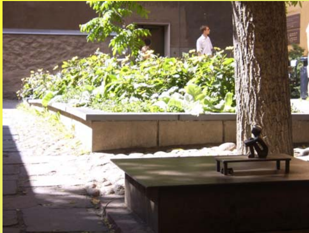
Tukholman pienin patsas