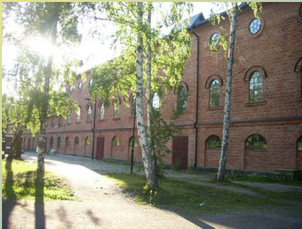
Vanha Nobelin dynamiitin kehityksessä käytetty rakennus