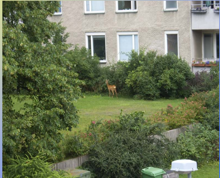
Sisäpihan lemmikki: city-bambi