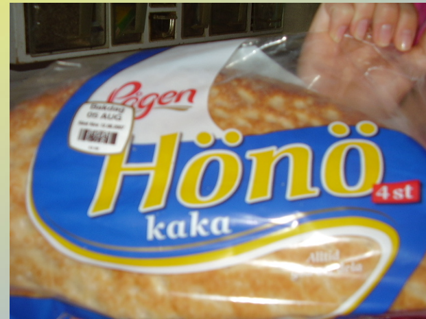
Tyhjentävä leivän nimi 😊