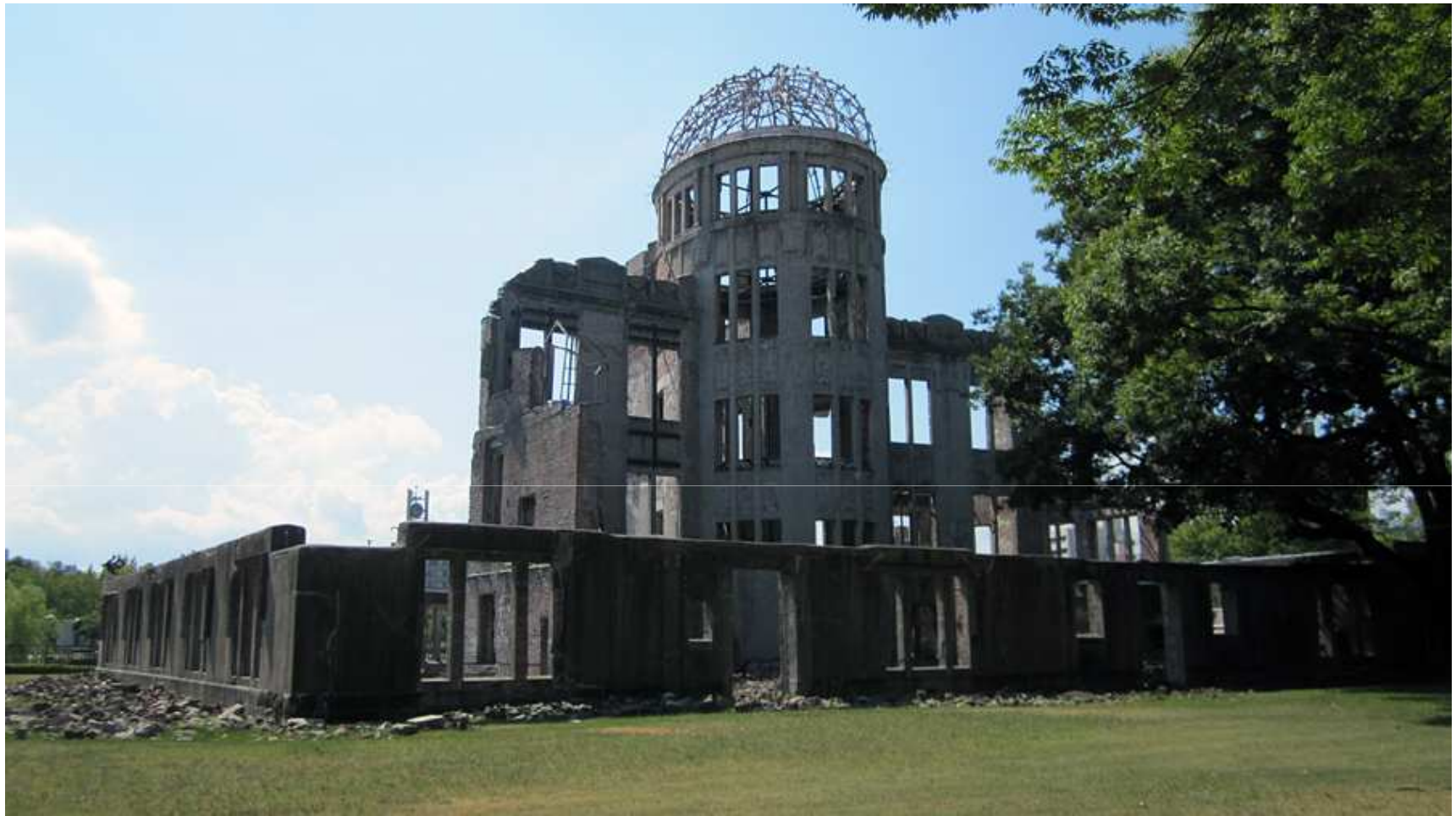
ATOMIC BOMB DOME