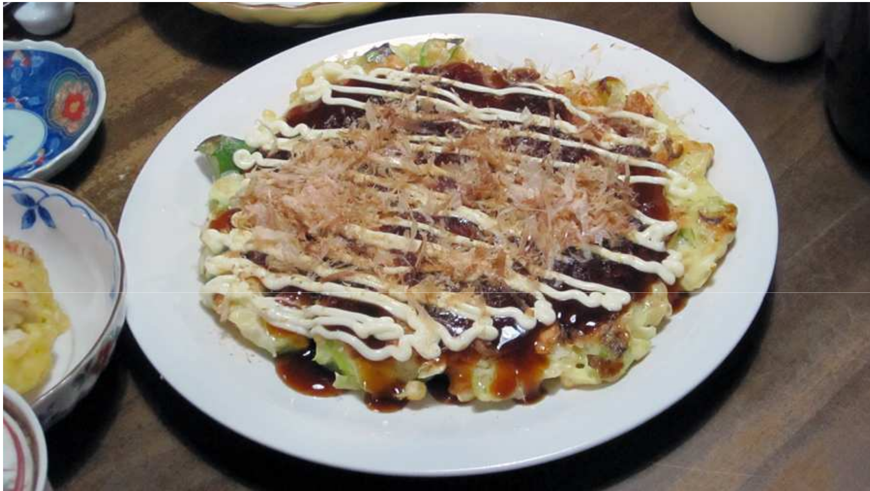
JAPANILAINEN MUNAKAS/PIZZA –HYBRIDI, OKONOMIYAKI