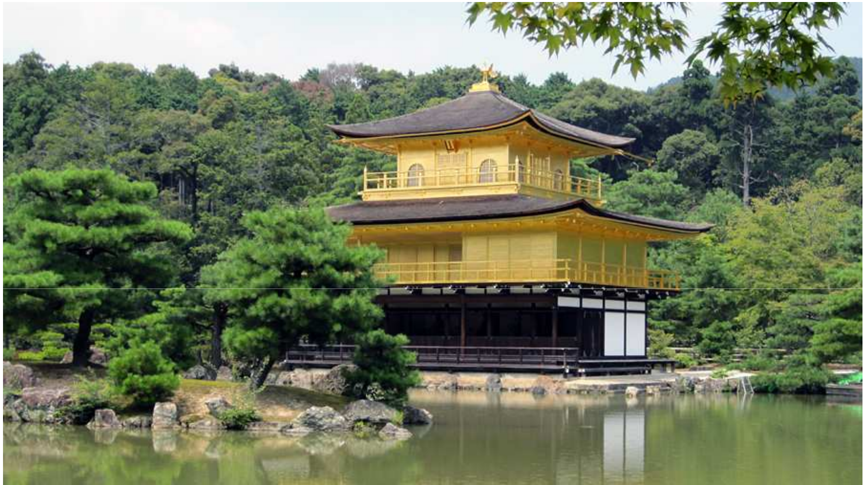
KINKAKU-JI, KULTAINEN TEMPELI