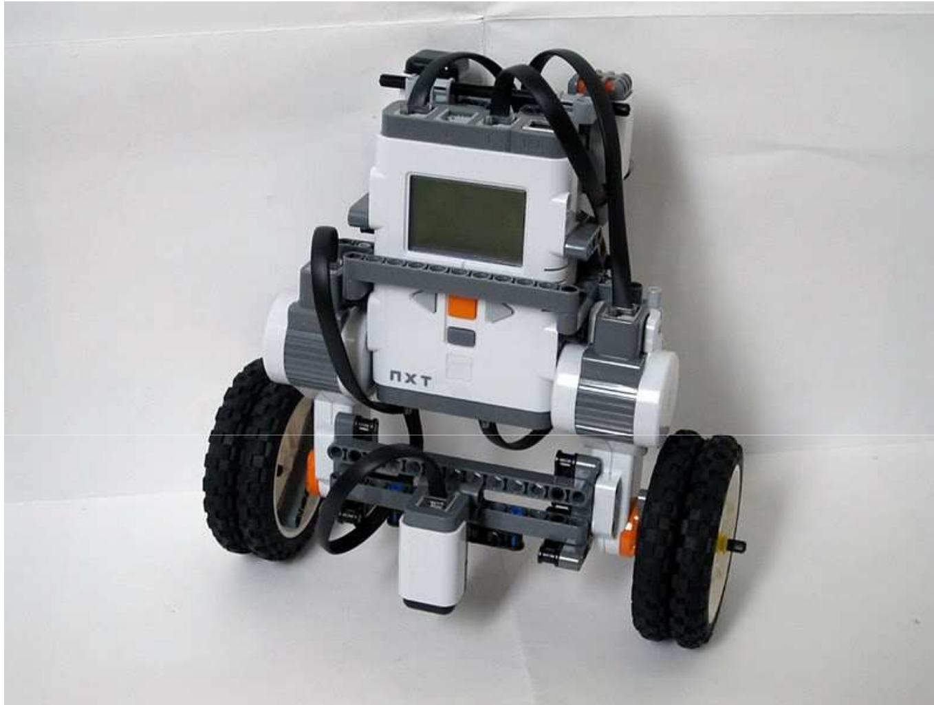
LEGO NXT -TASAPAINOTTELUROBOTTI