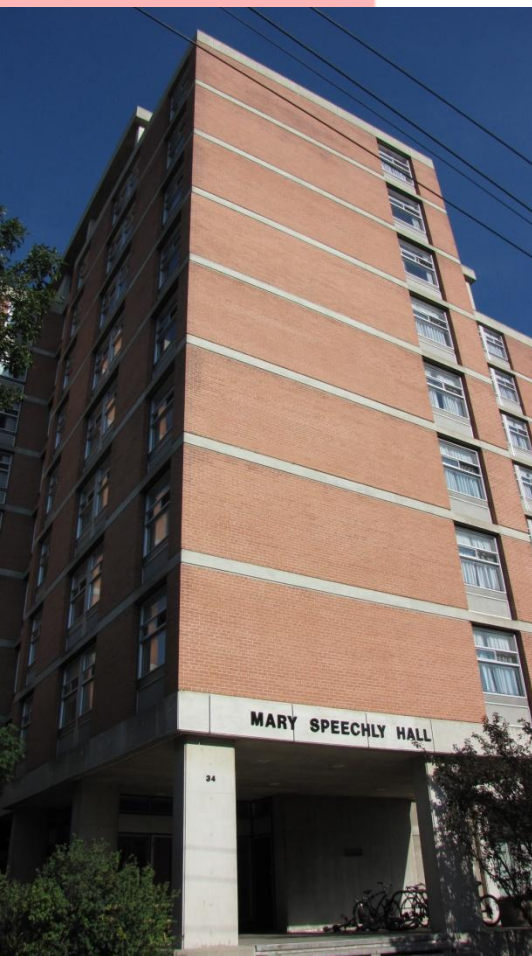
Oma asuntolani MSH