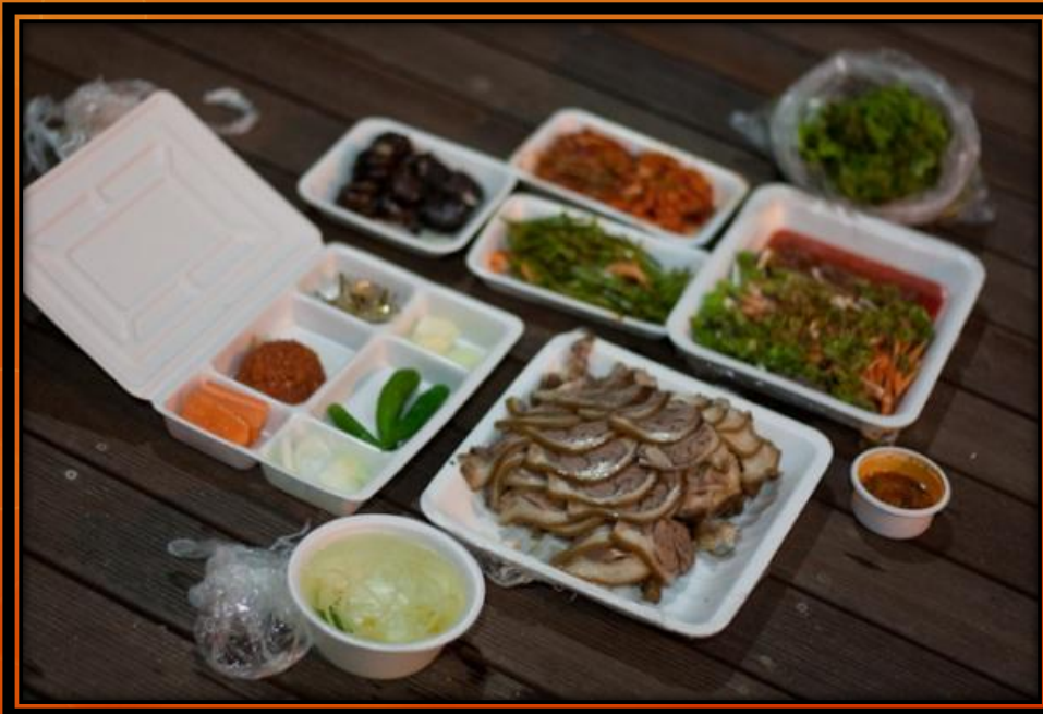
Kuvassa mm. porsaanjalkaa ja sisäelimiä

Opiskelija-asuntolassa ei ollut keittiötä eikä mahdollisuutta ruuanlaittoon. Syöminen tapahtui pääasiassa siis ulkona, joko kampuksen ruokaloissa tai porttien ulkopuolella ravintoloissa. Ateria maksoi paikasta riippuen 4000-10000 KRW (2,60-6,50e). Ruoka oli yllättävän makeaa ja jopa snacksit oli sokeroituja. Mausteistakin ruokaa löytyi kunhan uskalsi kysyä sellaista! Kimchi (fermentoitu kaali) tuli tutuksi, muita hyviä kokemuksia olivat korealainen BBQ, bibimbap ja bulgogi.