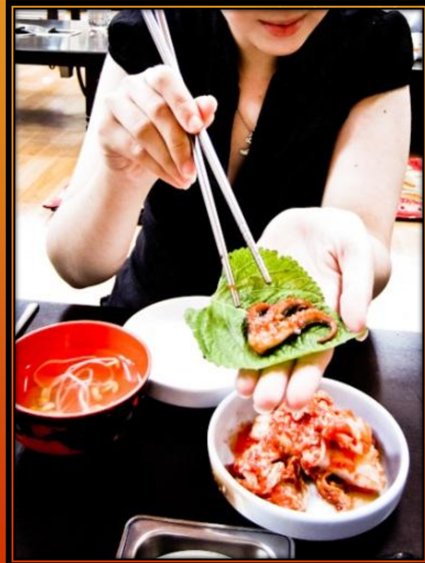
Jjuggumi – mausteista mustekalaa